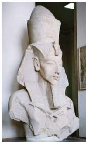
Busto do Faraó Akhenaton, no Museu Egípcio, Cairo.

Akhenaton não é lembrado pela riqueza, nem pelo poderio militar egípcio. Não valorizava nada disto, nem mesmo se contentava em predicar os cânones consagrados como verdade pela casta sacerdotal dominante. Viveu a vida de um sábio enquanto ocupava o trono.