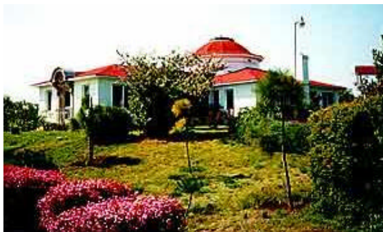
Departamento de Cura, The Rosicrucian Fellowship

“Acrésceta meu amor por Ti Senhor Para que eu possa servir-Te de melhor forma cada dia. Faça com que as palavras de meus lábios, E as meditações de meu coração sejam gratas à Teus Olhos. Ó Senhor , minha força , meu Redentor”