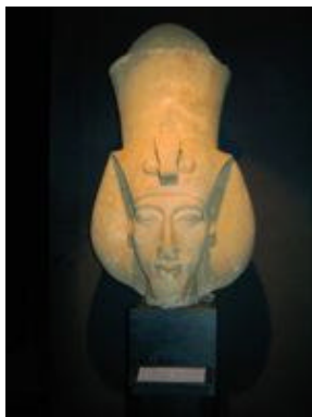
Busto de Akhenaton. Museu de Alexandria, Egito.

Akhenaton proibiu que Aton fosse idolatrado através de imagens. Simbolizou-o como um disco solar irradiando raios de luz . Dirigiu a atenção do povo ao “Calor que está no Sol” , que representa o Cristo Cósmico, o Espírito Invisível e interno do Sol, que existe atrás do esplendor externo do Sol. Ao círculo interno Akhenaton se refere ao Sol Espiritual , não como “Aton” , mas como o “Mestre de Aton” . Mais tarde substitui a palavra Calor por Resplendor