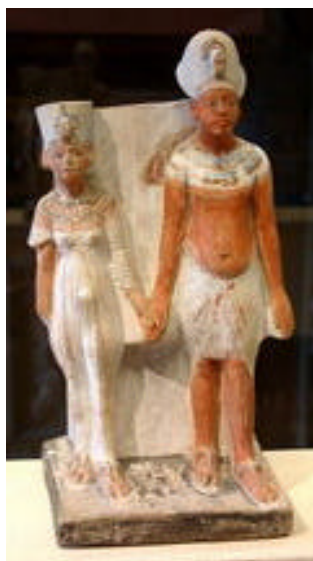
Akhenaton e Nefertiti

O intervalo compreendido entre os treze e quatorze anos, é sempre um tempo marcante na vida de um Grande Mestre, sinalizando a direção que irá escolher em seu caminho. Este significativo período em sua vida brindou o casamento de Akhenaton com Nefertiti e sua ascensão ao trono.