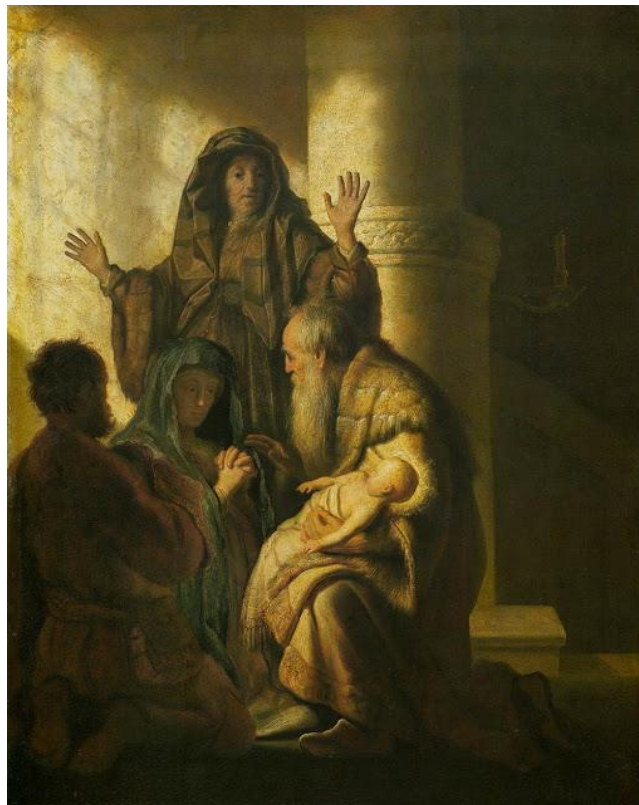
Simão e Ana reconhecem o Senhor em Jesus, Rembrandt van Rijn, 1627 Kunsthalle Hamburg

“Ainda que eu falasse as línguas dos homens e dos anjos e não tivesse caridade, nada seria.”