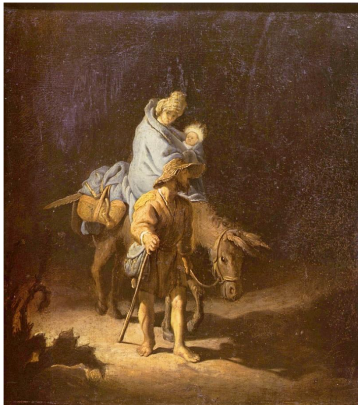
A Fuga para o Egito, Rembrandt, no Musée des Beaux-Arts de Tours, na França.

“Ninguém tem maior amor do que este: de dar alguém sua vida por seus amigos.”