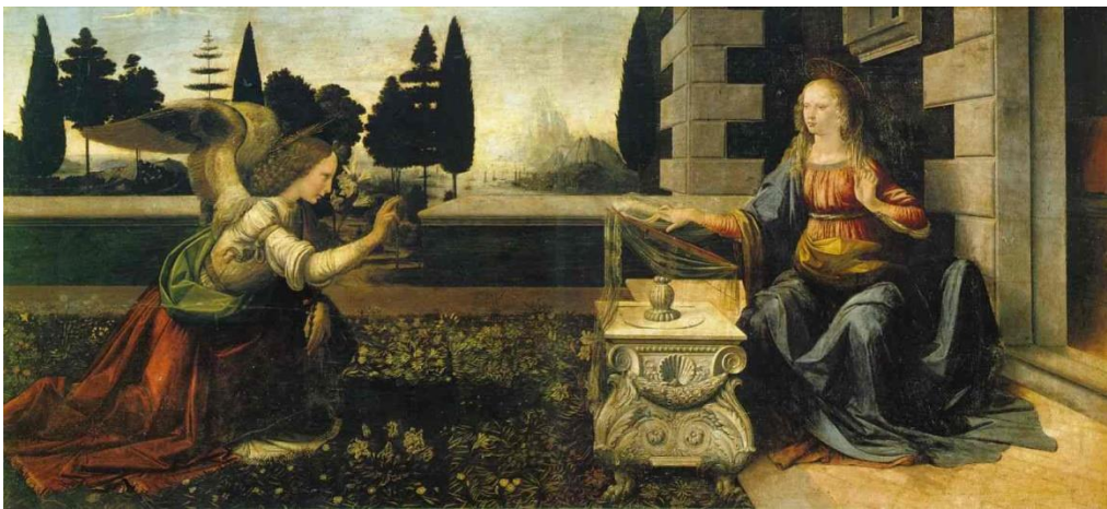
Leonardo da Vinci, Anunciação , 1472.

“ Toda a boa dádiva e todo o dom perfeito vem do alto, descendo do Pai das luzes.”