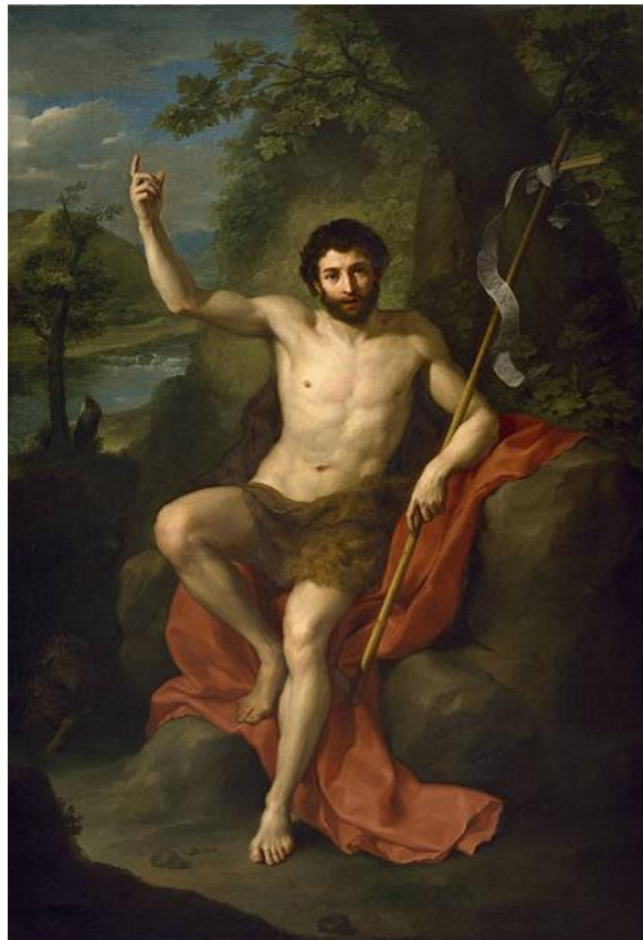
João Batista pregando no deserto Anton Raphael Mengs, 1760

“ Preparai o caminho do Senhor, endireitai as suas veredas. ”