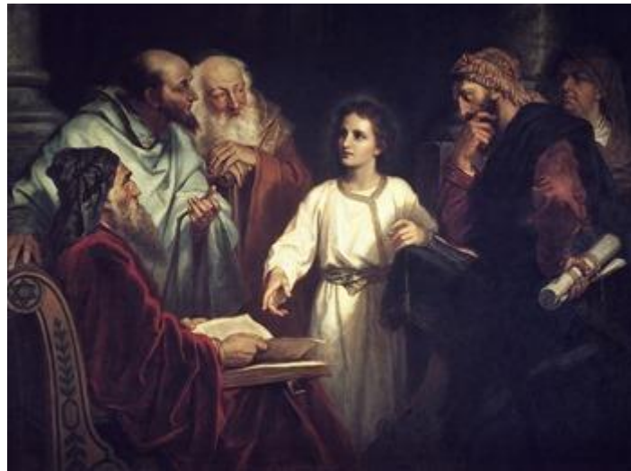
Jesus entre os Doutores no Templo

“ Não sabeis que me convém tratar dos negócios de meu Pai? ”