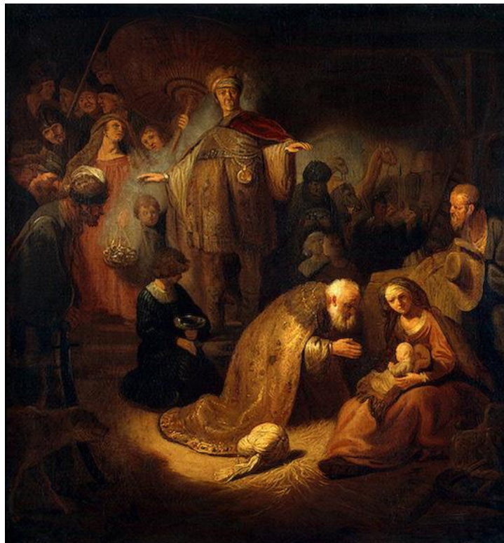
Adoração do Reis Magos, Rembrandt, 1632

“ Vimos a sua estrela no oriente, e viemos adorá-lo.