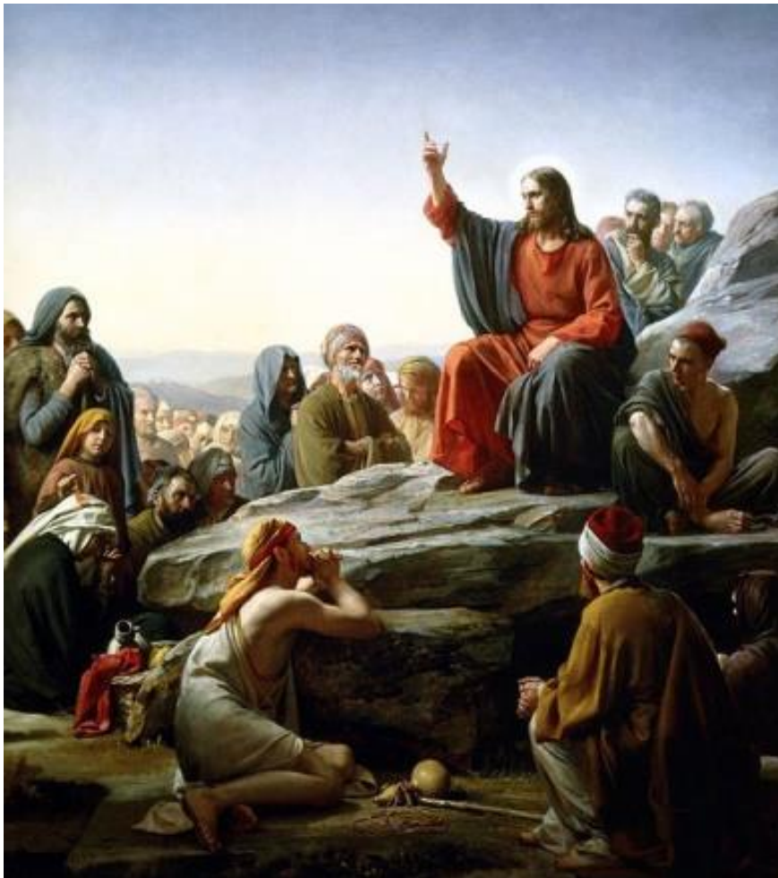
Sermão da Montanha, por Carl Bloch, século XIX

Lição extraída de “Rosicrucian Fellowship Sunday Schools” Tradução da Fraternidade Rosacruz Max Heindel - Rio de Janeiro - Brasil