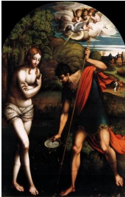
Batismo de Jesus

“ Este é o meu Filho amado, em quem me comprazo.”