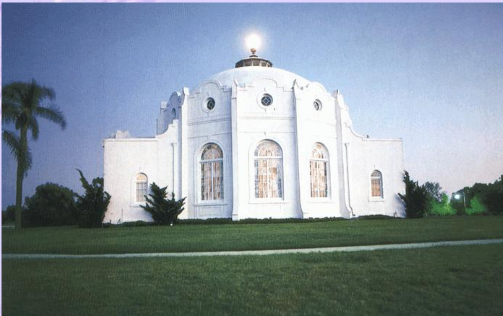
Templo Rosacruz em Mt. Ecclesia, Oceanside , CA, USA

"Não se iluda, Deus não esquece nada: o que o homem semear ele também colherá".