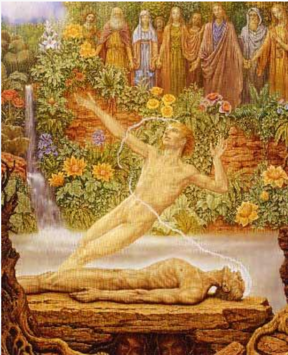
CROSSING OVER, Johfra, 1989