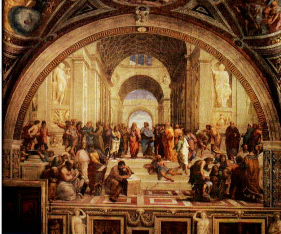
A Escola de Atenas é um fresco de Rafael Sanzio, com cerca de 7,7m na base, pintado entre 1509 e 1510 na Stanza della Segnatura sob encomenda do Vaticano.

No seu famoso quadro "A Escola de Atenas", Rafael apresentou de uma forma muito hábil as atitudes dessas duas escolas de pensamento. Vemos nesse maravilhoso quadro um átrio Grego, semelhante aqueles em que os filósofos outrora costumavam congregar-se. Sobre os diversos degraus que conduzem ao interior do edifício, vê-se um grande número de homens mergulhados em profunda conversação, mas, no centro, no cimo dos degraus, permanecem duas figuras que se supõe serem Platão e Aristóteles, um apontando para cima, o outro para a terra, encarando-se mudos, mas com profunda e concentrada determinação, cada um pretendendo convencer o outro de que sua opinião é a verdadeira, porque ambos estão convictos em seu coração. Um deles sustenta que é feito do barro da terra, que veio do pó, ao qual voltará; o outro advoga firmemente a idéia de que há algo superior que sempre existiu e continuará existindo, não importa o que possa acontecer ao corpo em que se vive agora.