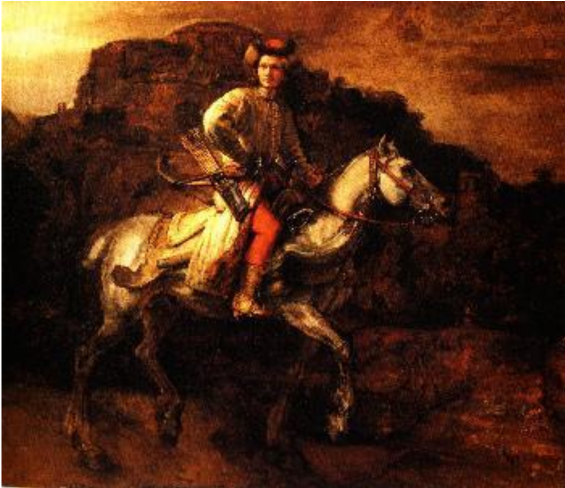
O Cavaleiro Polonês. (Pintura de Reembrandt, 1655.

Retrato atribuído ao Grande Mestre Rosacruz, o Conde de St. Germain, que segundo Max Heindel foi uma das últimas encarnações de Christian Rosenkreutz