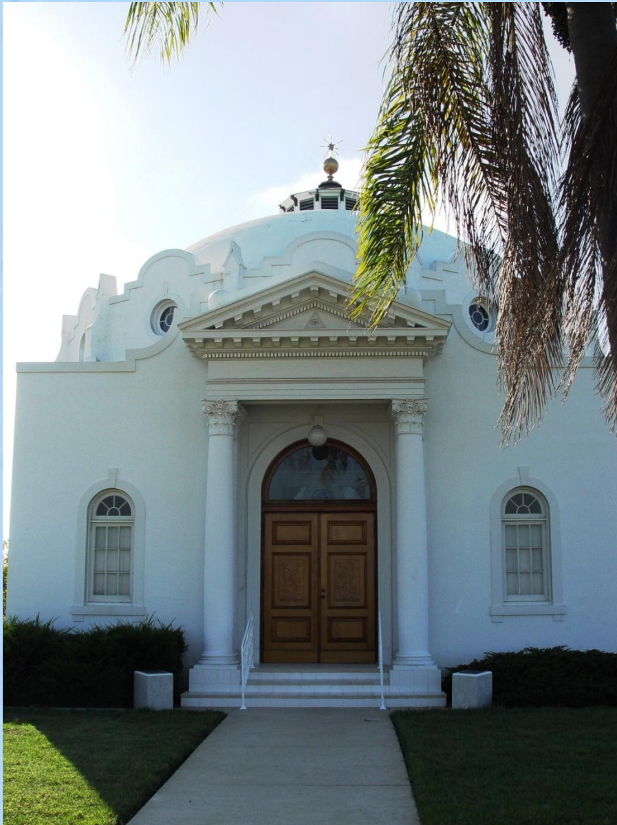
Templo Rosacruz em Mount Ecclesia, Oceanside, CA

A Fraternidade Rosacruz, cuja sede mundial está situada em Mt. Ecclesia, Oceanside, California, foi fundada em 1909 por Max Heindel, que organizou e dirigiu todos os seus trabalhos até 1919, data de sua partida física. Sucedeu-o sua esposa Sra. Augusta Foss Heindel, que consolidou a obra a frente de um Conselho Diretor.