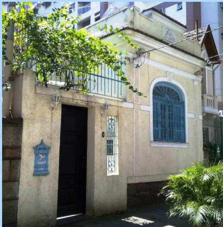
Fachada da Fraternidade Rosacruz – Centro Autorizado do Rio de Janeiro

O Movimento Rosacruz, publica e mundialmente iniciado pelo engenheiro Max Heindel, é fundamentalmente uma Escola de reforma interna para a humanidade, uma Escola de desenvolvimento e expansão de consciência, tratando de nossa origem espiritual e da finalidade de nossa evolução.