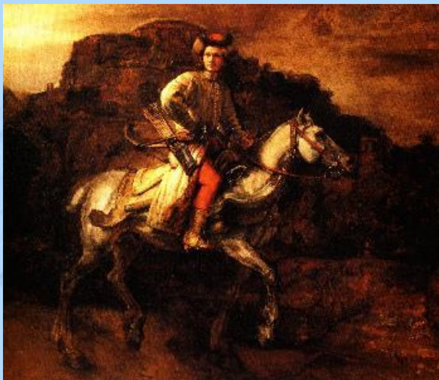
O Cavaleiro Polonês. (Pintura de Reembrandt,1655.

Retrato atribuído ao Grande Mestre Rosacruz, o Conde de St. Germain, que segundo Max Heindel foi uma das últimas reencarnações de Christian Rosenkreutz