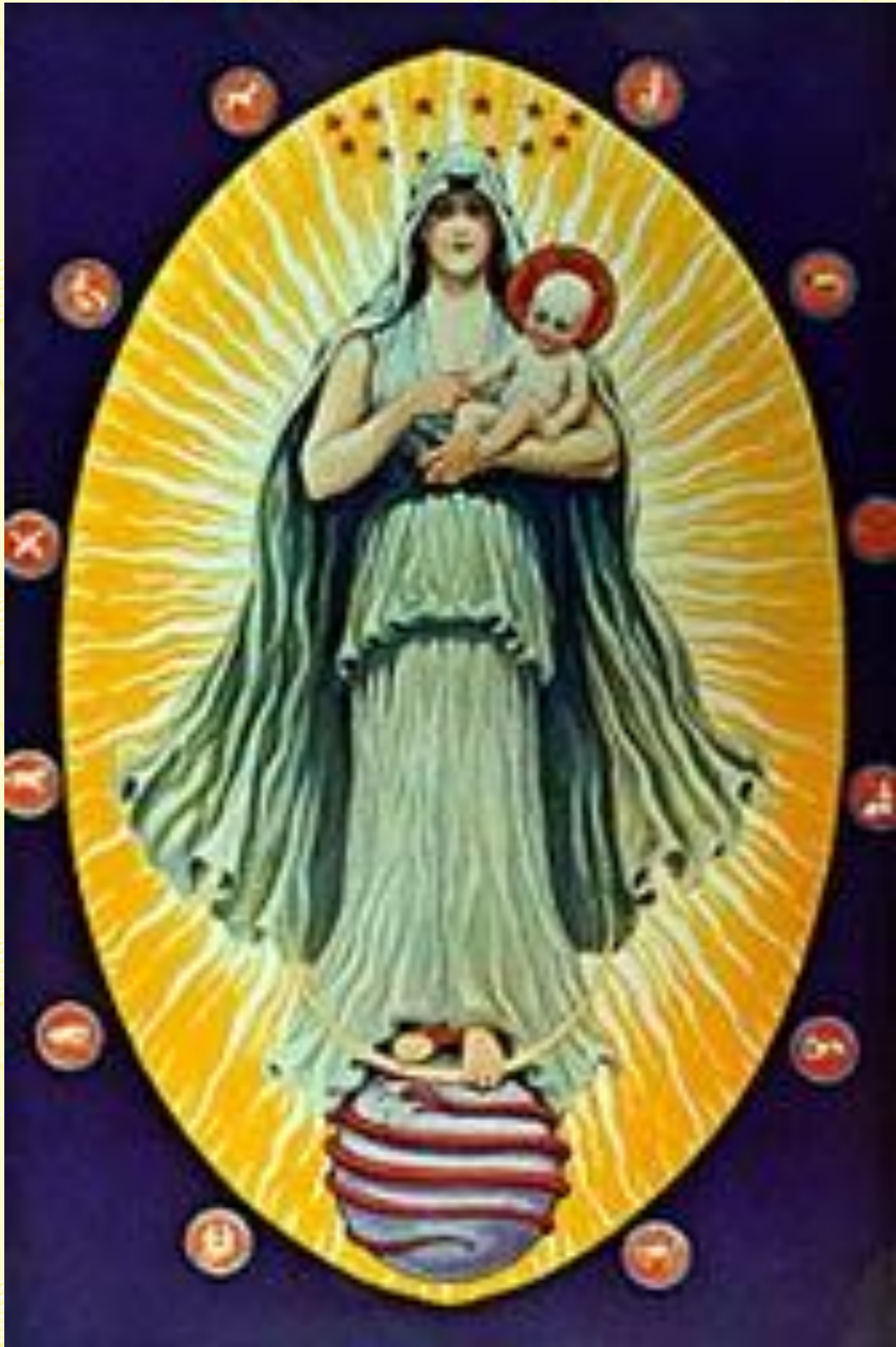
JAKnaap, The Virgin with the Divine God Sun