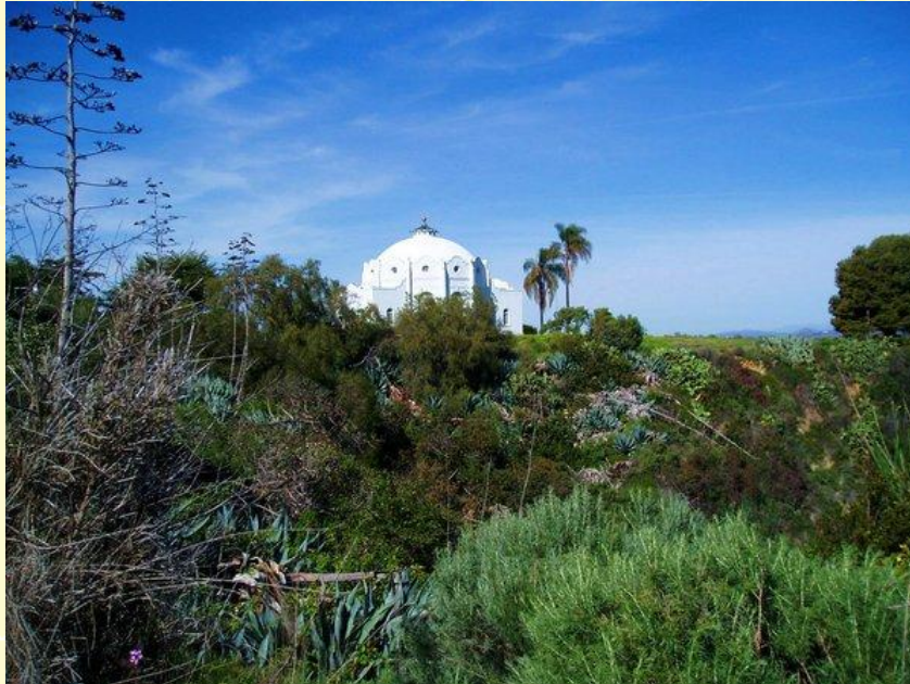
Templo Rosacruz em Mount Ecclesia, Oceanside, California.

A Fraternidade Rosacruz Max Heindel não é uma seita ou organização religiosa, mas sim uma grande Escola de Pensamento. Sua finalidade precípua é divulgar a admirável filosofia dos Rosacruzes, tal como ela foi transmitida ao mundo por Max Heindel, escolhido para esse fim pelos Irmãos Maiores da Ordem Espiritual.