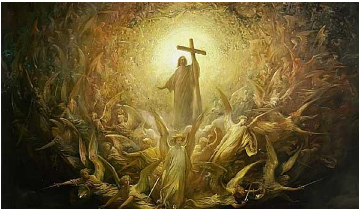
Triunfo de Cristo por Gustave Dore, 1868