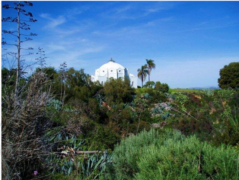
Templo Rosacruz em Mount Ecclesia, Oceanside, California.

A Fraternidade Rosacruz Max Heindel não é uma seita ou organização religiosa, mas sim uma grande Escola de Pensamento. Sua finalidade precípua é divulgar a admirável filosofia dos Rosacruzes, tal como ela foi transmitida ao mundo por Max Heindel, escolhido para esse fim pelos Irmãos Maiores da Ordem Espiritual.