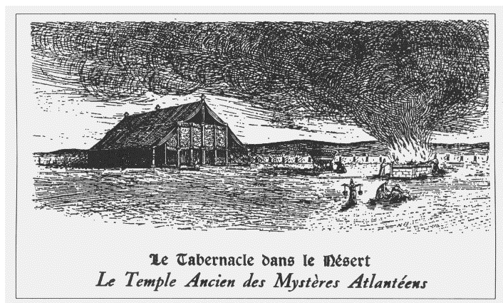
Diagrama - El tabernáculo en el desierto